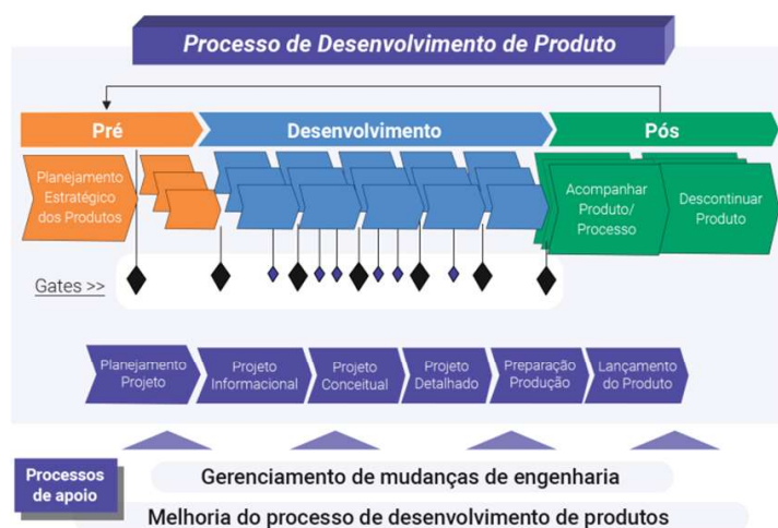
FIGURA 01 - Modelo de Rozenfeld

33. De acordo com o Manual de Oslo (1997), entende-se por inovação de produto, a criação de produtos (bens ou serviços) novos, ou significativamente melhorados. Esta inovação pode ser radical, com a criação de um produto nunca antes visto, que poderá criar um novo mercado, ou incremental, através de atualizações que darão mais competitividade ao mesmo, como novos recursos ou funções, prolongando o seu ciclo de vida. Porém, a inovação deve ser um processo contínuo, sendo necessário que se crie um ambiente interno propício. A Figura 01 representa o Modelo de Rozenfeld, na qual percebe-se que “o processo de desenvolvimento de produto é um conjunto de atividades realizadas em uma sequência lógica, com o objetivo de produzir um bem ou serviço que tem valor para um grupo específico de clientes” (HAMMER e CHAMPY, 1994, apud GONÇALVES, 2009, p.07).